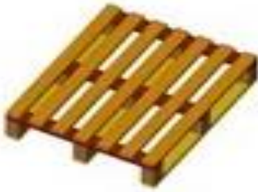
מסמך קובץ: 120x100 ס"מ